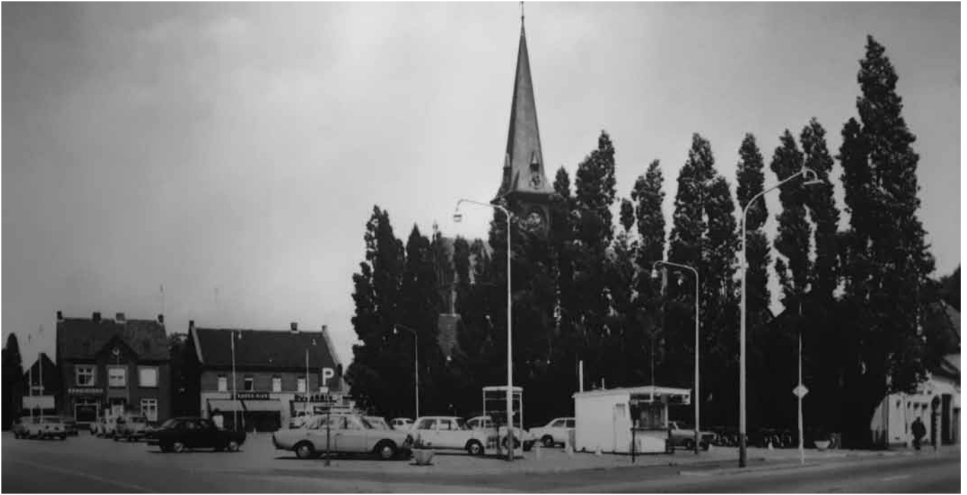
Markt Reuver in de jaren 60 van de vorige eeuw en dezelfde plaats na de renovatie in 2022