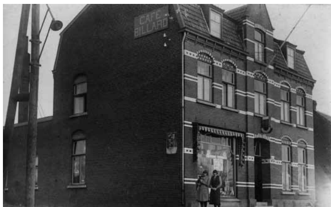
Winkel en café gevestigd in het Hoge Huis

Na de oorlog bleef Het Hoge Huis een zakenpand. Eerst begon Sjaek Goossens er een groentehandel, daarna zat de familie Hermans-Spee er met een winkel en vervolgens besloten Pieter Hermans en