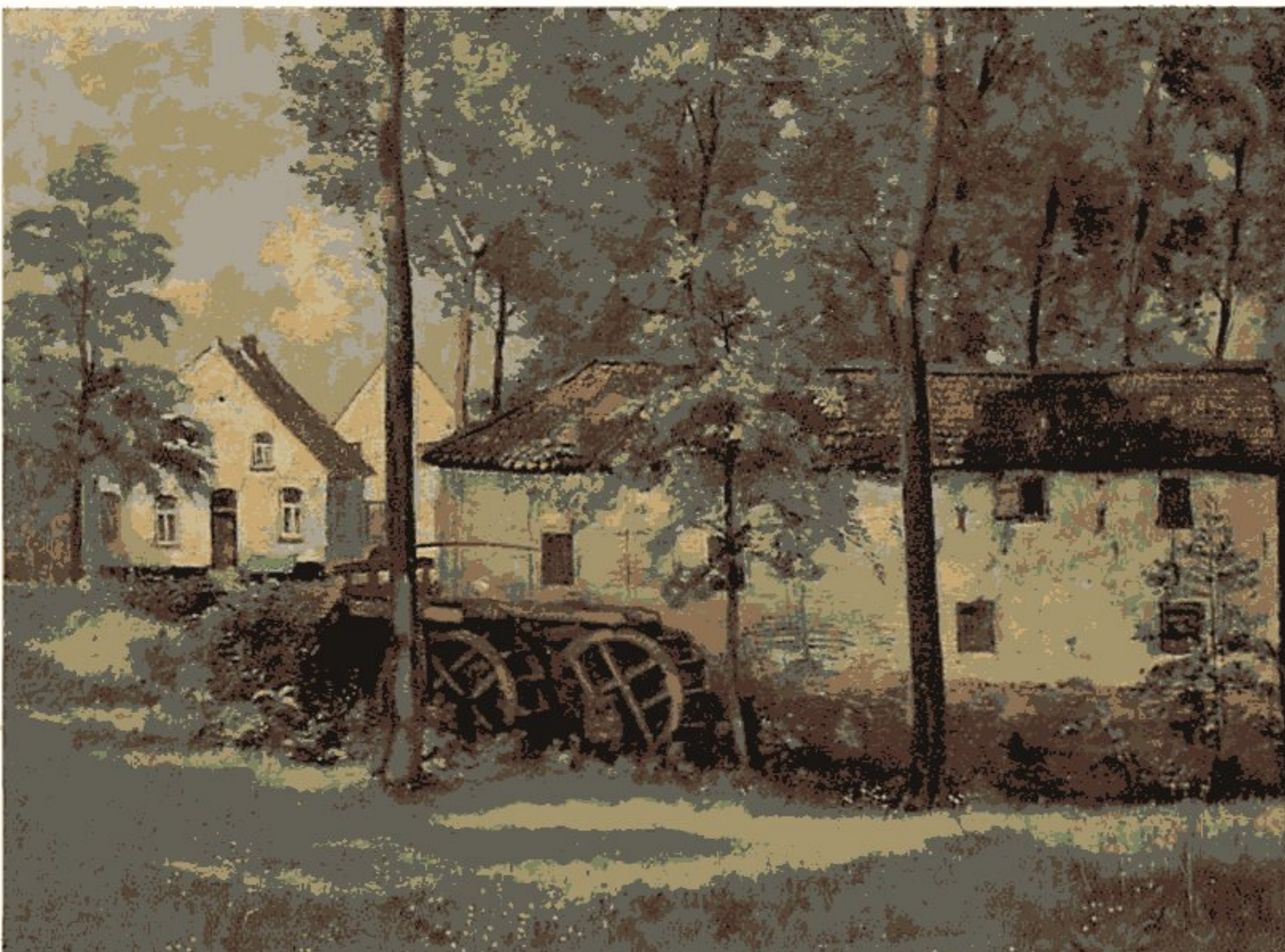
De molen van Ronckenstein geschilderd door J. Moonen naar de situatie rond 1915. Schilderij in bezit van de fam. Cremers.

Haar slechtste tijd viel rond 1600, toen als gevolg van de oorlogstoestand en de barre klimatologische omstandigheden zeer weinig graan werd aangevoerd. Haar beide concurrenten, de Molen van Offenbeek en de Molen van Maalbeeck, gingen in die tijd zelfs ten onder. Omdat ook blijkbaar de leenheer van de molen, de Heer van Nieuwenbroeck, in deze tijd weinig binnenkreeg, kwam de molen in particulier bezit en wel van de familie Van Ronckenstein. In 1761 werden de beide molens (de graan- en de oliemolen) verplaatst, zodat we mogen aannemen dat het huidige gebouw en de wijer uit dat jaar stammen.