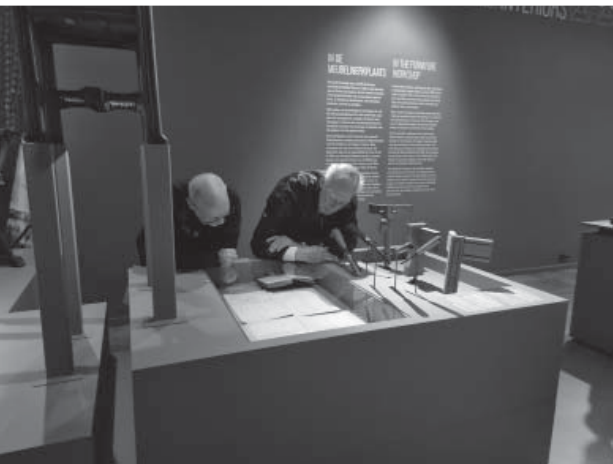
In het Cuypershuis Roermond