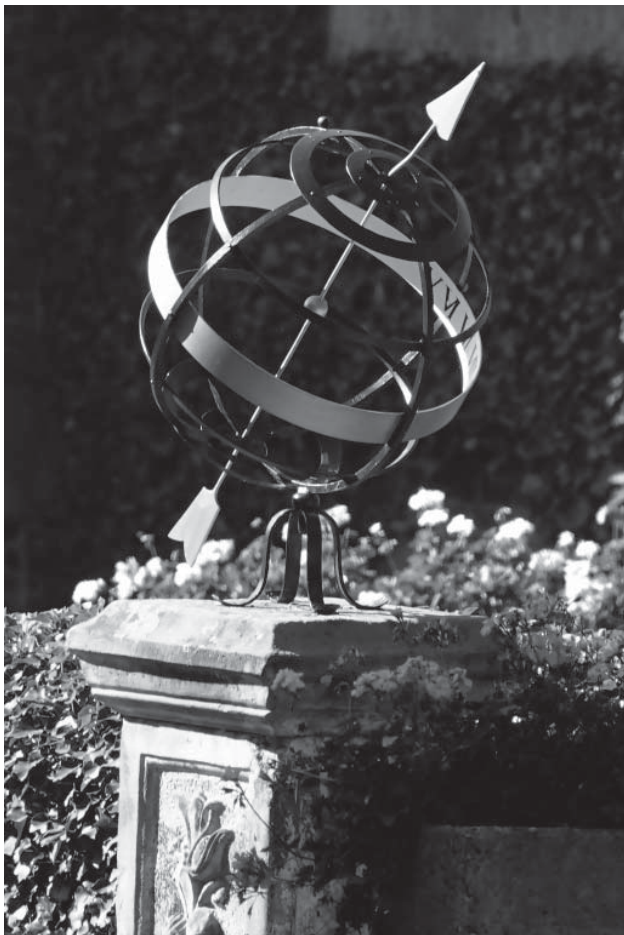
Zonnewijzer op voorplein kasteel Hillenraad

“De tijd snelt voort”, zeiden ook reeds de ouden; al hadden zij geen chronometers, waarop zij het verstrijken der uren konden aflezen. De alleroudste vorm van tijdaanwijzing vinden wij in de zonnewijzer, waarvan reeds in de vroegste oudheid wordt gewag gemaakt. Ongetwijfeld was dit dan ook het meest voor de hand liggend, eenvoudige instrument, dat met onfeilbare zekerheid de tijd aanwees. Dit neemt niet weg dat de zonnewijzer vele bezwaren had. Vertoont de zon zich niet,