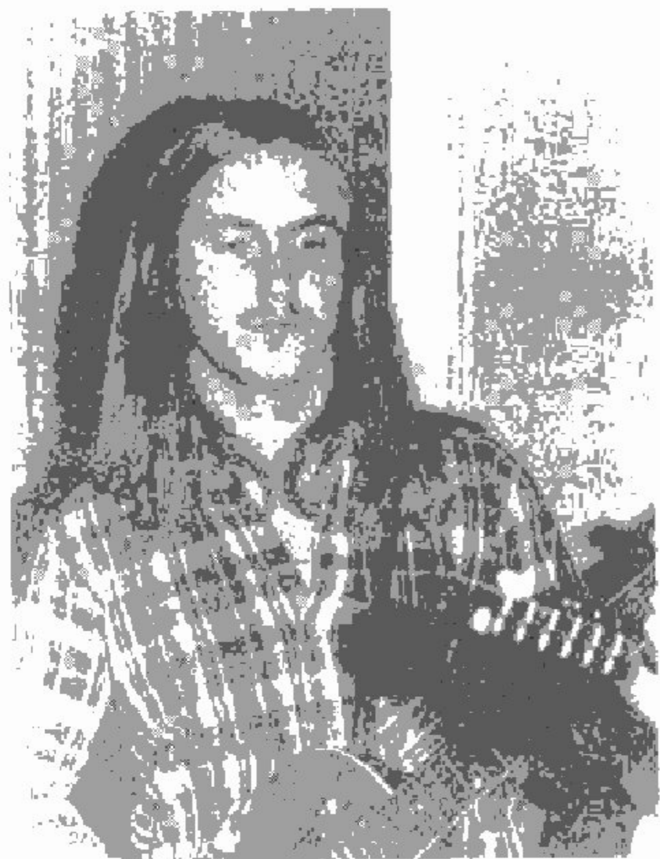
Alias, Mumos Session muzikant, een van de trekpleisters op de "PIEJUS" jam sessie

Tevens werd er een succesvolle "Jam-Session" georganiseerd, waaraan verschillende muzikanten uit omliggende plaatsen hebben deel genomen.